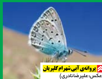
پروانه‌ی آبی شهرام گلپریان