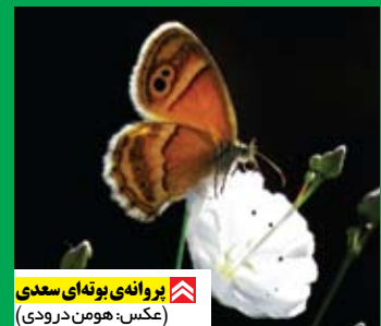
پروانه‌ی بوته‌ای سعدی