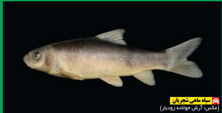
سیاه‌ماهی شجریان

محققان سراسر جهان معمولاً نام‌های شاعران و بزرگان فرهنگ برای نام‌گذاری گونه‌های جدیدشان استفاده می‌کنند؛ از موارد این چنین می‌توان به پروانه‌ی بوته‌ای سعدی ( Coenonympha saadi )، عنکبوت تورچادری فردوسی ( Oecobius ferdowsii )، پروانه‌ی آبی فردوسی ( Polyommatus firdussii )، پروانه‌ی ایولاس خیام ( Iolana iolas )، پروانه‌ی آبی حافظ ( Polyommatus coelestinus hofzi )، سیاه‌ماهی فردوسی ( Capoeta ferdowsii ) و سیاه‌ماهی مخدوم‌قلی ( Capoeta pyraghi ) اشاره کرد. سرده‌ای از عنکبوت‌های جهنده ( Rudakius ) و نیز گونه‌ای از همین عنکبوت‌ها ( R. rudakii ) به نام رودکی نام‌گذاری شده‌اند. اخیراً، محققان ایرانی گونه‌هایی را نیز به اسم برخی هنرمندان نام‌گذاری کرده‌اند: عنکبوت میرشکار رامبد جوان ( Cebrennus rambodjavani ) به پاس فعالیت‌های زیست‌محیطی رامبد جوان، هنرمند مشهور، نام‌گذاری شد. پیش از این در شماره‌ی ۱۶۴ دانشتینها پرونده‌ای به این نام‌گذاری اختصاص داده شد. سیاه‌ماهی شجریان ( Capoeta shajariani ) نمونه‌ی دیگری بود که اخیراً به احترام استاد محمدرضا شجریان نام‌گذاری شد. سال ۲۰۱۵ (۱۳۹۴)، سرده‌ای جدید از عنکبوت‌های سنگی (Hersiliidae) از کرمان نیز به احترام دکتر محمدابراهیم باستانی یاریزی، تاریخدان، نویسنده، پژوهشگر و استاد بازنشسته‌ی دانشگاه تهران به نام Bastanius نام‌گذاری شد. پاول اسکالا، پروانه‌شناس اهل کشور چک، در سال ۲۰۰۱ (۱۳۸۰) گونه‌ای را به نام شهرام گلپریان، گرافیست و آهنگساز معاصر ایرانی به نام Polyommatus shahrami نام‌گذاری کرد. او این نام‌گذاری را متأثر از موسیقی گلپریان انجام داد و آن را یکی از تجربیات فرهنگی بر جسته‌اش در سفر به ایران دانست.