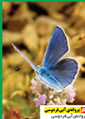
پروانه‌ی آبی فردوسی (پروانه‌ی آبی فردوسی)