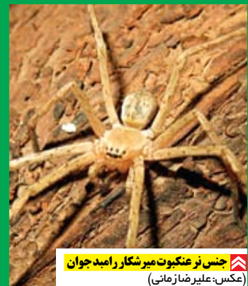
جنس نر عنکبوت میرشکار رامبد جوان